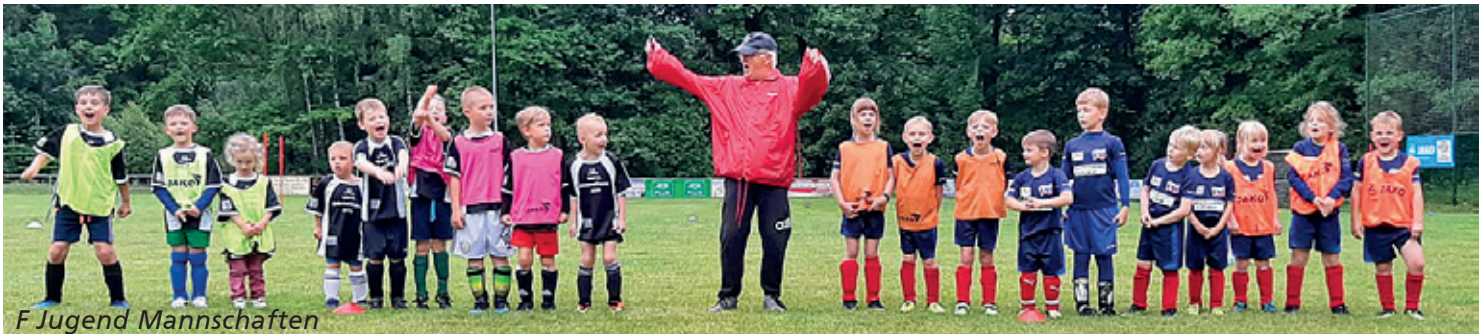
F Jugend Mannschaften